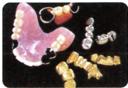
撤去冠・除去冠及び不要な歯科合金